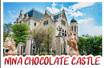
NINA CHOCOLATE CASTLE

ทะเลสาบสุริยันจันทรา - ไทเป 101 จิวเฟิ่น - NINA CHOCOLATE CASTLE MONSTER VILLAGE - ชิเหมินต้ง เมนูพิเศษ ปลาประจานาธิบดี เซี่ยวหลงเปา / ซาบูใต้หวัน