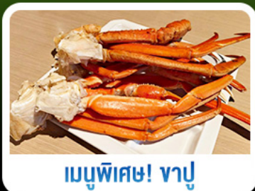
เมนูพิเศษ! ซาซิมิ