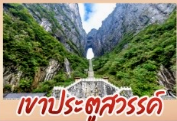
เขาประตูสวรรค์