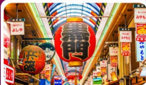
ตลาดปลาคุโรมง