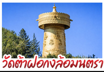
วัดต้าเฟอ กงล้อมนตรา