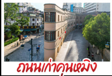
ถนนเก่าคุณหมิง