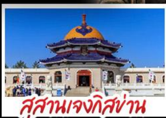
สุสานเจกิสข่าน