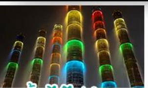
น้ำพุไม้ไผ่ตักSKP