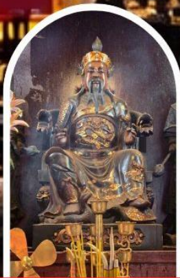
วัดปักโต

ขอเทพเจ้ากวนอู ความซื่อสัตย์ เงินทอง ธุรกิจมั่นคง