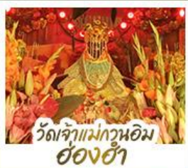
วัดเจ้าแม่กวนอิมอ่องฮ่า