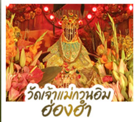
วัดเจ้าแม่กวนอิม ฮ่องฮ่า