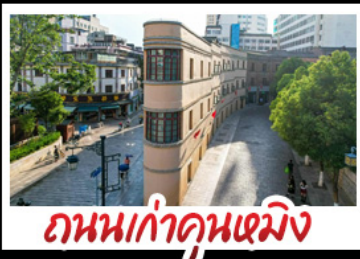
ถนนเก่าคุณเหมิง