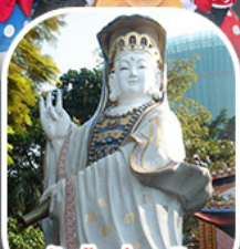
วัดเจ้าแม่กวนอิม รีพัลส์เบย์