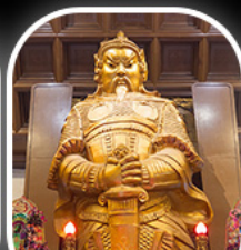
วัดเขงกหมิว