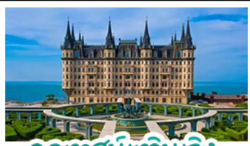
คฤหาสน์เวินนิง

เมืองเก่าซิงคโปร์ - คุกาสัมหลวมอิง เบียร์ซิงคโปร์ + อาหารทะเล สตรีทอาร์ต สตูดิโอจิบลิ