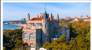
ป่าด้ากวน

พระราชวังฤดูร้อน - วิวเมืองซิงเต่า รถไฟความเร็วสูง - ภูเขาเหลาซาน กำแพงเมืองจีนด่านจวิยงกวน - ป่าด้ากวน พักโรงแรมระดับ 4 ดาว - ไม่ลงร้านช้อปปิ้ง มือพิเศษ เปิดปักกิ่ง , หม้อไฟซีฟู้ด