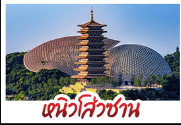
หิวซ่าซาน

DISNEYLAND SHANGHAI เต็มวัน หิวซ่าซาน - พระใหญ่หลังซานต้าผอ NORTH BUND GREENLAND ช้อปปิ้ง ซิม ซิล ถ่ายรูปแลนด์มาร์กมหานครเซี่ยงไฮ้ มือพิเศษ บุฟเฟ่ต์ BBQ, เสี่ยวหลงเปา