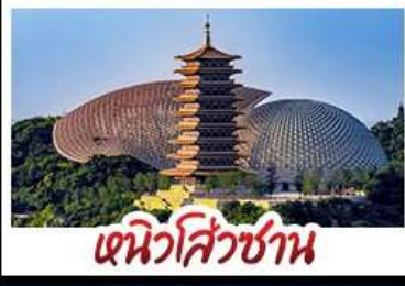
เทนิวไฮ่ซาน

DISNEYLAND SHANGHAI เต็มวัน ทิวไฮ่ซาน - พระใหญ่หลิงซานต้าฝอ NORTH BUND GREENLAND ซ้อป ซิม ซิล ถ่ายรูปแลนด์มาร์กมหานครเซี่ยงไฮ้ นื้อพิศข บุปเฟ่ต์ BBQ, เสี่ยวหลงเปา