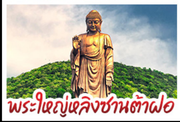
พระใหญ่หลังซานต้าผอ