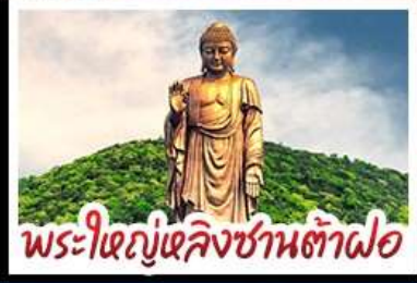
พระใหญ่หลิงซานต้าฝอ