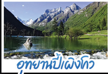
อุทยานปักหมุด