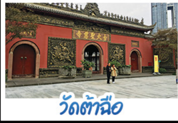
วัตต้าฉือ