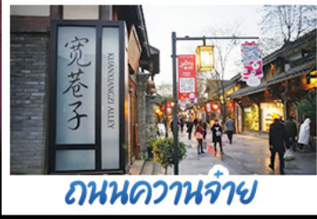
ถนนความจำ