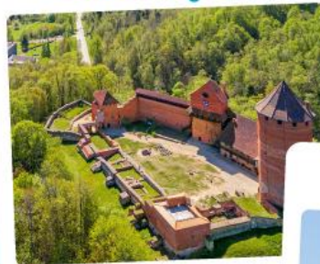
ปราสาทไครด้า