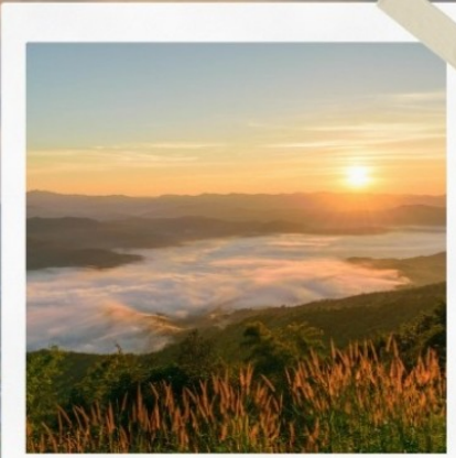
ทอย/สมอทาว