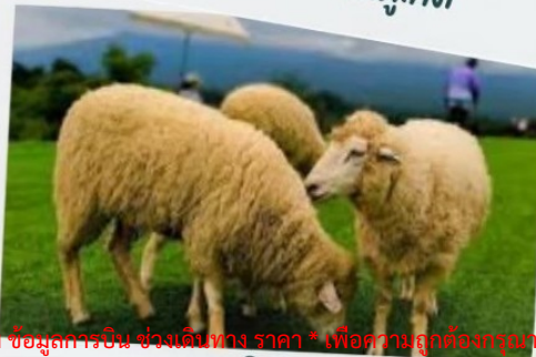
ฟาร์มแกะ