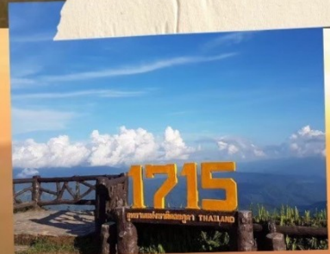
จุดชมวิวกว1715