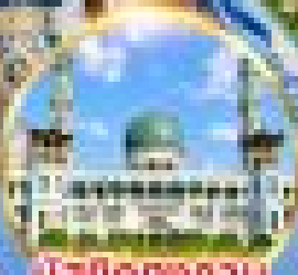
มัสยิดหลวง