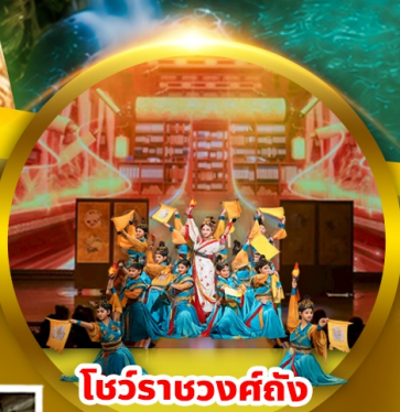
โชว์ราชวงศ์ถัง