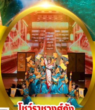
โชว์ราชวงศ์ถัง