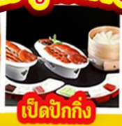
เปิดปิ้งกิ้ง