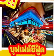
บุฟเฟต์ซีฟู้ด