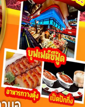
บุฟเฟต์ซีฟู้ด