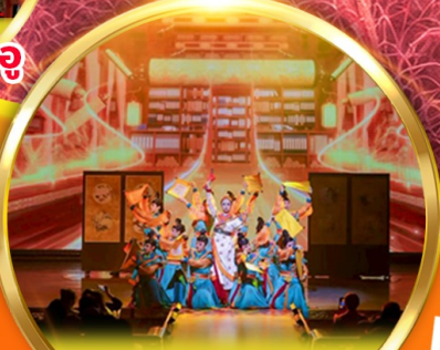
โชว์ราชวงศ์ถัง