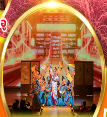
โชว์ราชวงศ์ถัง