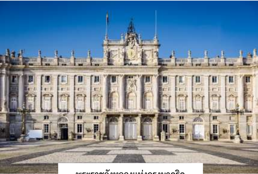
พระราชวังหลวงแห่งกรุงมาดริด (Royal Palace of Madrid)

นำท่านเข้าชม พระราชวังหลวงแห่งกรุงมาดริด (Royal Palace of Madrid) (ขอสงวนสิทธิ์ในการงดเข้าชมภายในพระราชวัง ในกรณีที่มีการจัดพิธีการสำคัญหรือกิจกรรมของราชสำนัก โดยอาจปรับเปลี่ยนโปรแกรมเข้าชมพระราชวังอื่นแทน) พระราชวังหลวงแห่งนี้ตั้งอยู่บนเนินเขาริมแม่น้ำแมนซานาเรส (Manzanares) โดดเด่นด้วยความโอ่อ่า สง่างาม และงดงามไม่แพ้พระราชวังใดในทวีปยุโรป เริ่มก่อสร้างในปี ค.ศ. 1738 ด้วยวัสดุหินทั้งหลัง ภายใต้สถาปัตยกรรมแบบบาร็อคผสมผสานระหว่างศิลปะฝรั่งเศสและอิตาลีอย่างลงตัว ภายในพระราชวังประกอบด้วยห้องต่าง ๆ มากกว่า 2,830 ห้อง ที่ได้รับการตกแต่งอย่างวิจิตรบรรจง ทั้งยังเป็นที่เก็บรักษาผลงานศิลปะชิ้นสำคัญจากจิตรกรชื่อดังในยุคนั้น