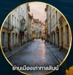
ย่านเมืองเก่าทาลลินน์