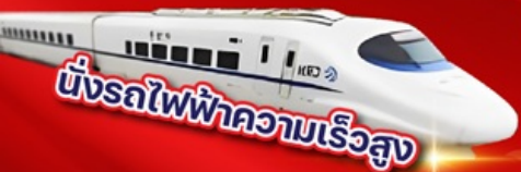
ขั้รถไฟฟ้าความเร็วสูง