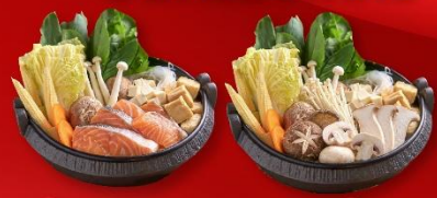
สุกี้ปลาแซลมอน+สุกี้เห็ด