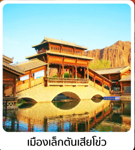
เมืองเล็กต้นเซียะโซ่ว