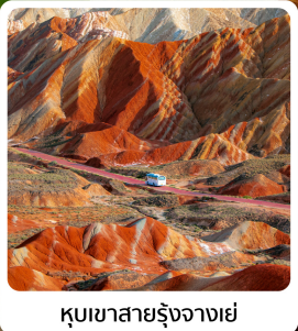
ภูเขาสายรุ้งจาซเย่