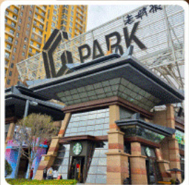
ห้าง G Park