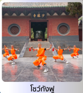
โชว์กังฟู