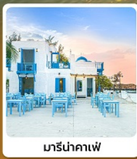
มารีนาคาเฟ่