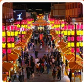
ตลาดกลางคินซาโจว