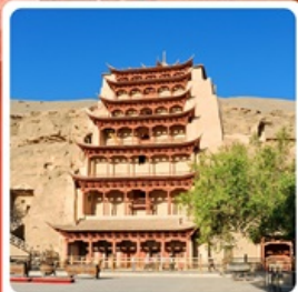
กำแพงเกาหลู