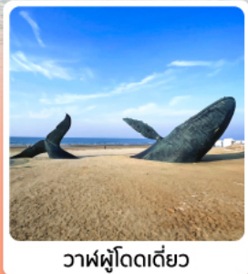
วาฬฟู่โอดเดี่ยว