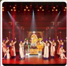
The Heritage Show