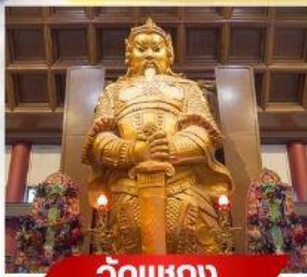
วัดเขากง