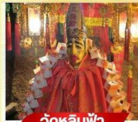
วัดหลิมฟ้า