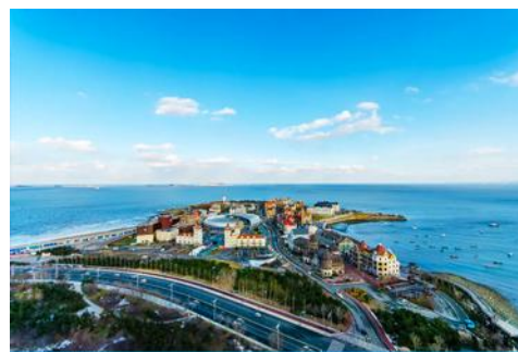
ท่าเรือชาวประมงไห่ชาว

หมายเหตุ เรือท่องเที่ยวที่จองตัวได้ในแต่ละวันอาจมีเวลาแตกต่างกันในบางวัน บริษัทฯ ขอสงวนสิทธิ์ในการเปลี่ยนแปลงเวลาของเที่ยวเรือโดยมิแจ้งล่วงหน้า