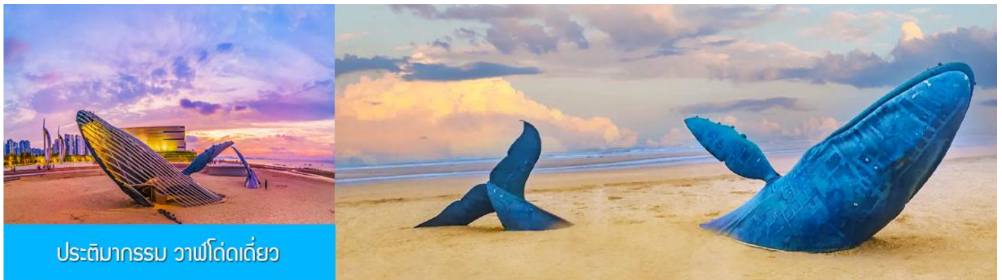
ประติมากรรม วาฬโศกเดี่ยว

05.30 น. เรือท่องเที่ยว นำคณะเดินทางถึงท่าเรือเมืองเยินไถ นำท่านขึ้นรถบัสเพื่อเดินทางสู่ตัวเมืองเยินไถ เช้า รับประทานอาหารเช้า ณ ห้องอาหารของโรงแรม (7) หลังอาหารนำท่านเที่ยวชม ท่าเรือชาวประมงไห่ซาง 烟台海昌鱼人码头 ท่าเรือนี้เต็มไปด้วยสถาปัตยกรรมสไตล์อเมริกาเหนือ และยุโรป ให้ท่านได้สัมผัสและเก็บภาพบรรยากาศที่แสนโรแมนติกริมทะเล ที่มีอาคาร