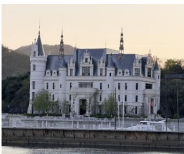
ท่าเรือประมงหู่กาน

พักที่ DALIAN JUZISHUIJING HOTEL / SANSHUI HOTEL โรงแรมระดับ 4 ดาวท้องถิ่น ต้าเหลียน