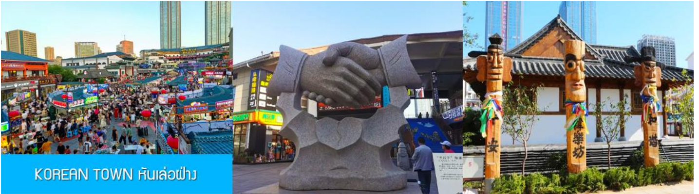
KOREAN TOWN หันเล่อฝาง

จากนั้นนำท่านสู่ ย่านเกาหลี KOREAN TOWN หันเล่อฝาง 韩乐坊 แหล่งท่องเที่ยวระดับ 3A ที่ชุกจนเซ็ป วัฒนธรรมเกาหลีของเมืองเวย์ไห่ ประกอบด้วยถนนคนเดินเกาหลี ประตุน้ำสี่สาย หอเฉลิมฉลอง และจัตุรัส วัฒนธรรมเล่อเทียนที่มีความโดดเด่นด้านสถาปัตยกรรม ให้ท่านได้เดินชม เก็บภาพ ลิ้มรสอาหารพื้นเมืองใน ย่านเกาหลีได้อย่างเต็มอิม..