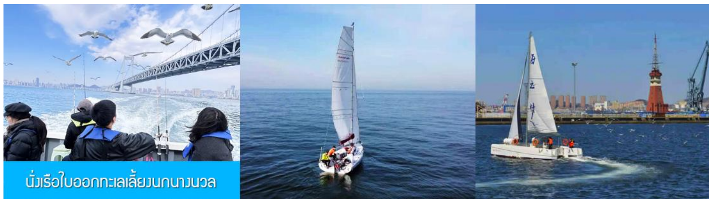
นั่งเรือใบออกทะเลลิ้นนกนางนวล