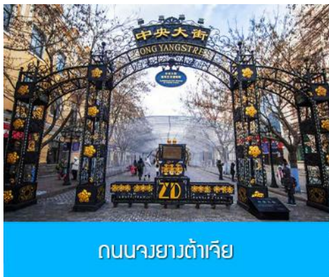
ถนนจงยางต้าเจีย