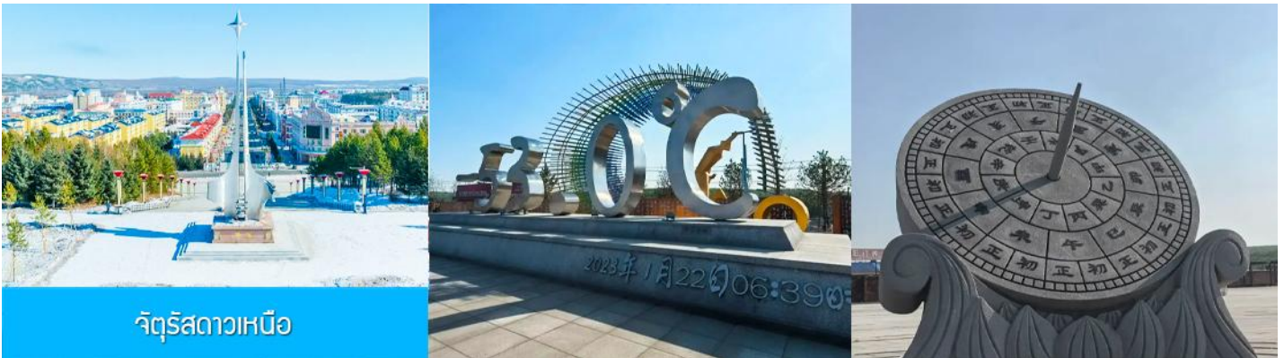
จัตุรัสดาวเหนือ