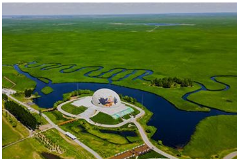
อุทยานชุ่มชื้นจาหลง

รับประทานอาหารเช้า ณ ห้องอาหารของโรงแรม (7)