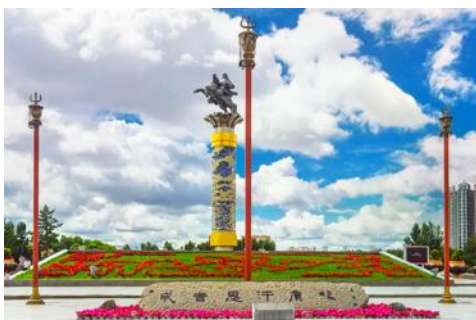
จัตุรัสเวงกิสข่าน

หลังอาหารนำท่านเดินทางสู่เมือง ไห่ลาเอ่อ 海拉尔市 (ระยะทาง 456 กม. ใช้เวลาเดินทางราว 5 ชั่วโมงครึ่ง)