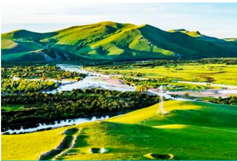
ภูเขาเหยาซานโถว

เช้า รับประทานอาหารเช้า ณ ห้องอาหารของโรงแรม (13)