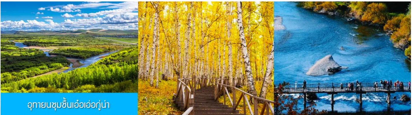
อุทยานชุ่มชื้นเอ้อเอ่อกู่ฮา

เช้า รับประทานอาหารเช้า ณ ห้องอาหารของโรงแรม (16)