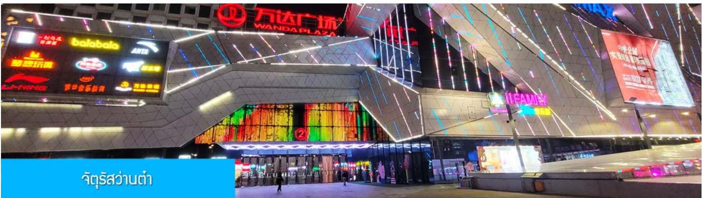
จัตุรัสว๋านต้า

หลังอาหารนำท่านเดินทางสู่เมือง ฉีฉีฮาร์เอ๋อ 齐齐哈尔市 (ระยะทาง 319 กม. ใช้เวลาเดินทางราว 3 ชั่วโมงครึ่ง)