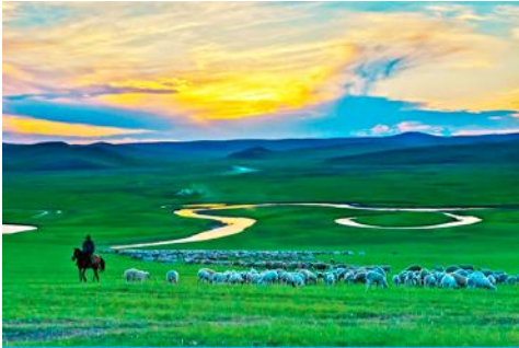
ทุ่งหญ้าฮูลุนเปี้ยเอ๋อ

เช้า รับประทานอาหารเช้า ณ ห้องอาหารของโรงแรม (10)