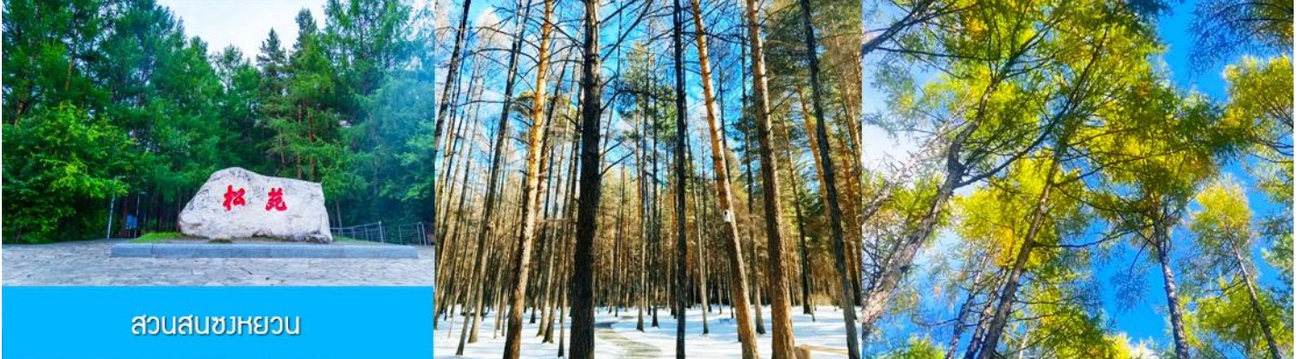
สวนสนขงหยวน

เช้า รับประทานอาหารเช้า ณ ห้องอาหารของโรงแรม (22)