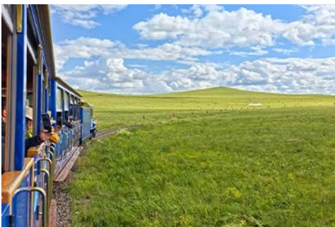
ชมบ้านชาวมองโก

เที่ยง รับประทานอาหารกลางวัน ณ ภัตตาคาร (14)