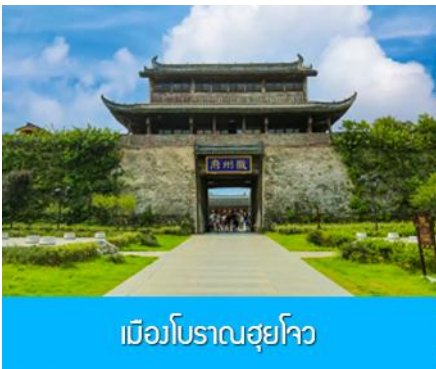
เมืองโบราณฮุยโจว

เช้า รับประทานอาหารเช้า ณ ห้องอาหารของโรงแรม (1)