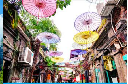
ย่านเทียนจื่อผา