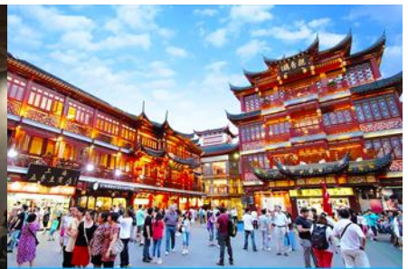
ย่านฉิงหวงเมี้ยว