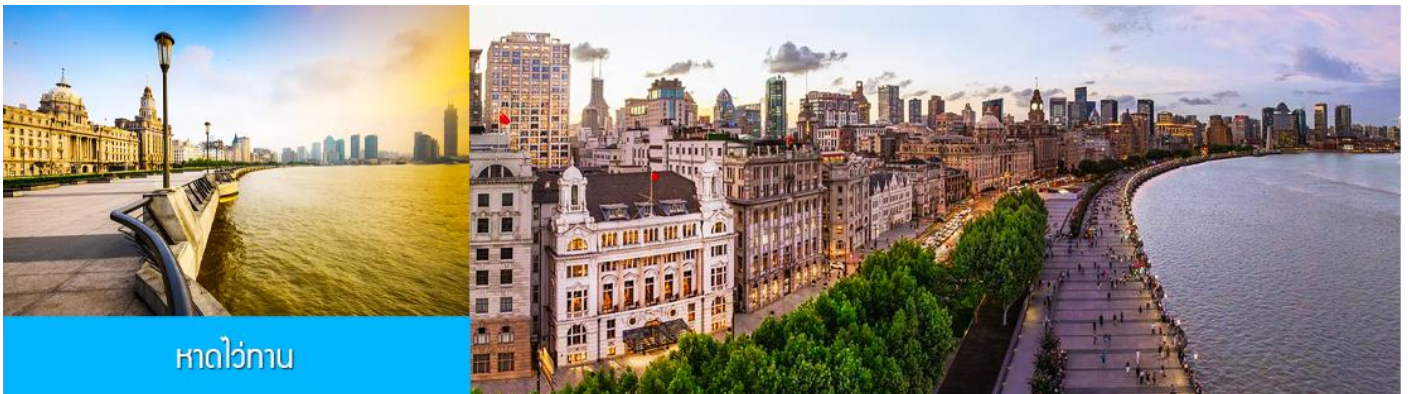
หาดว่อกาน

จากนั้นนำท่านเดินทางโดยรถบัสสู่นครเซี่ยงไฮ้ (ระยะทาง 200 กม. ใช้เวลาเดินทางราว 3 ชั่วโมงเศษ)