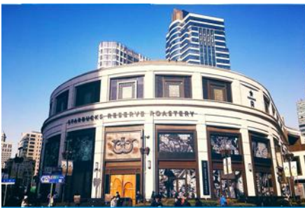
Starbuck Reserve Roastery

รับประทานอาหารเช้า ณ ห้องอาหารของโรงแรม (3)