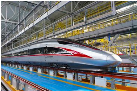
เบียร์รถไฟความเร็วสูง

หลังอาหารนำท่านเดินทางสู่สถานีรถไฟความเร็วสูงเมืองฮาร์บิ้น เตรียมขึ้นรถไฟความเร็วสูงสู่กรุงปักกิ่ง