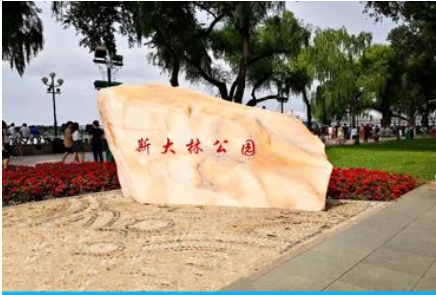
สวนสตาลิน