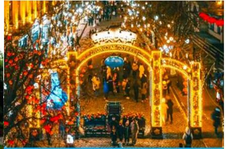
ถนนวยางต้าเจีย