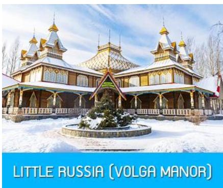
LITTLE RUSSIA (VOLGA MANOR)

เช้า รับประทานอาหารเช้า ณ ห้องอาหารของโรงแรม (11)