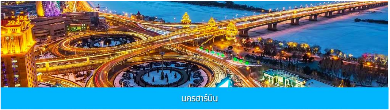
นครฮาร์บิน