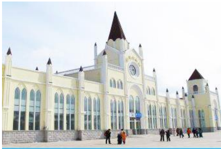
สถานีรถไฟฮาร์บิน

หมายเหตุ เพื่อความสะดวกในการเข้าพักใน HOME STAY ภายในหมู่บ้านหิมะ ทางทัวร์แนะนำให้ท่านจัดเตรียมเสื้อผ้าและเครื่องใช้เท่าที่จำเป็น 1 ชุดใส่กระเป๋าใบเล็กหรือเป้แบบสะพายได้ เพื่อสะดวกในการนำติดตัวไปใช้สำหรับคืนที่นอนในหมู่บ้านหิมะ หากนำกระเป๋าเดินทางใบใหญ่เข้าสู่ที่พักในหมู่บ้านอาจสร้างความไม่สะดวกแก่ท่าน จึงไม่แนะนำ