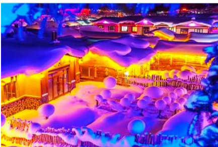
หมู่บ้านหิมะ Snow Town

ท่ามกลางท้องทุ่งและผืนป่าที่ปกคลุมด้วยหิมะราวกับอยู่ในโลกแห่งเทพนิยาย ผ่านหมู่บ้าน เวยหูจ้าย 威虎寨 ที่อดีตเคยเป็นที่ตั้งของรังโจรที่มักออกปล้นสะดมชาวบ้าน ม้าลากเลื่อนเป็นยานพาหนะเฉพาะพื้นที่ ๆ ที่นิยมนำมาใช้ในการเดินทางหรือลำเลียงสิ่งของในช่วงฤดูหนาว ที่ใช้ม้ามาลากงูแครงเลื่อนให้สามารถเคลื่อนย้ายบนลานหิมะได้