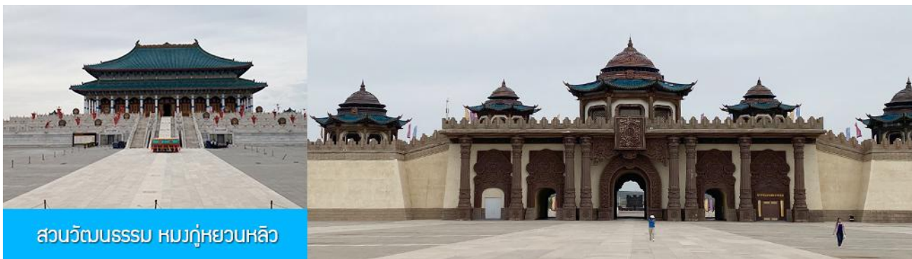
สวนวัฒนธรรมหมงกู่หยวนหลิว

หลังอาหารนำท่าน เที่ยวชม จวนอ๋องจวินหวัง 郡王府 จวนแห่งนี้เริ่มสร้างขึ้นในปี ค.ศ. 1902 สร้างเสร็จในปี ค.ศ. 1936 เป็นที่พำนักของ อ๋องอิฉีจวินหวัง 伊旗郡王 เป็นจวนอ๋องเพียงหนึ่งเดียวที่ได้รับการอนุรักษ์ในสภาพที่สมบูรณ์ โครงสร้างทำด้วยอิฐ หิน และไม้ ประกอบด้วยห้องพัก 16 ห้อง เป็นสถาปัตยกรรมผสมแบบมองโกล ทิเบต และฮั่น