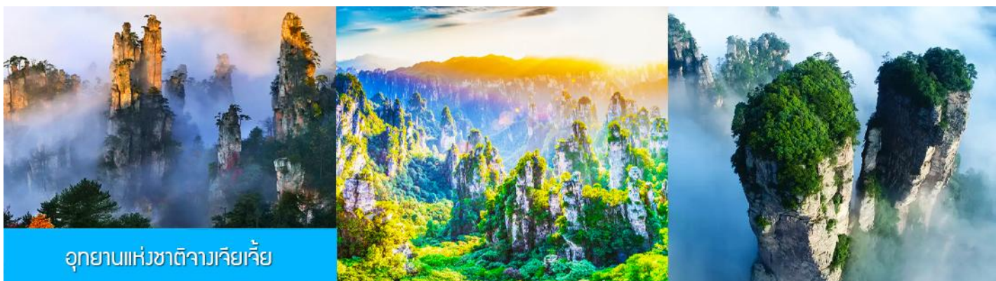
อุทยานแห่งชาติจางเจียเจีย

พักที่ TUWANGJU HOMESTAY โฮมสเตย์ในเมืองโบราณผู่หรงเจิน