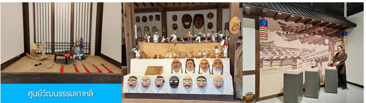
ศูนย์วัฒนธรรมเกาหลี

เช้า รับประทานอาหารเช้า ณ ห้องอาหารของโรงแรม (9)