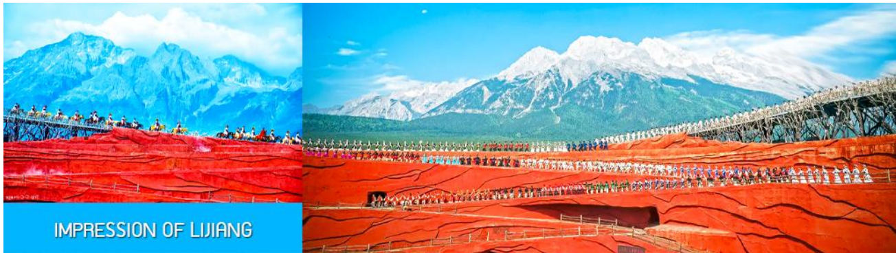
IMPRESSION OF LIJIANG

ชมการแสดง IMPRESSION OF LIJIANG การแสดง ณ เวทีการแสดงกลางแจ้งอันยิ่งใหญ่โดยผู้กำกับชื่อดังของโลก จางอวี๋โหมว ที่ได้ทุ่มเทฝีมือเนรมิตให้ภูเขาหิมะมังกรหยกเป็นฉากหลัง และสร้างเวทีกลางแจ้งและอัฒจันทร์กลางแจ้งเพื่อใช้ในการแสดง โดยใช้ทีมงานนักแสดงกว่า 600 ชีวิต ประกอบด้วยระบบแสง สี เสียง พร้อมการแต่งกายของเครื่องแต่งกายพื้นเมืองของเหล่านักแสดง โดยถ่ายทอดเรื่องราวชีวิตความเป็นอยู่ และชาวเผ่าต่างๆ ของเมืองลี่เจียงผ่านการแสดงในชุดต่าง ๆ