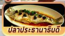
ปลาประรานาภิรมดี