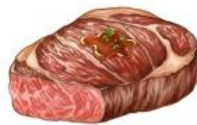
● เนื้อหมู