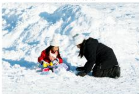
Playing in the snow