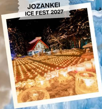
JOZANKEI ICE FEST 2027