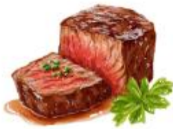
● เนื้อวัว

ขอความกรุณาแจ้งวัตถุประสงค์ที่ท่าน แพ้หรือไม่สามารถรับประทานได้