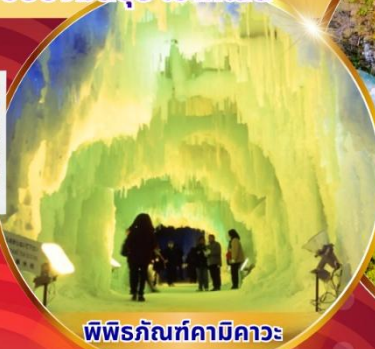
พิพิธภัณฑ์คามิคาวะ