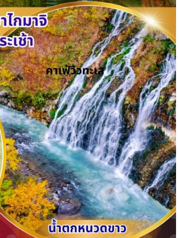
คาเฟว็องเต