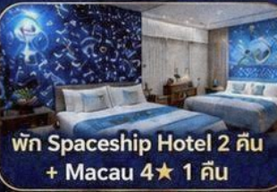
พัก Spaceship Hotel 2 คืน + Macau 4★ 1 คืน