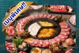
ซูฟไฟ่ชยาบู

พักโรงแรม 4 ดาว ★★★★★ ฟรี ประกันอุบัติเหตุ บริการอาหารท้องถิ่น