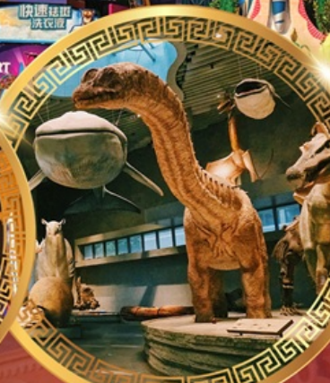
พิพิธภัณฑ์ธรรมชาติเซี่ยงไฮ้