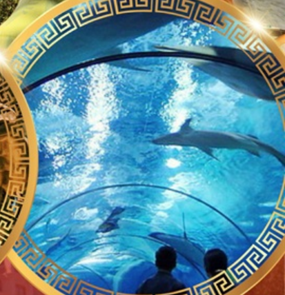
เซี่ยงไฮ้อาเซียนอะควาเรียม