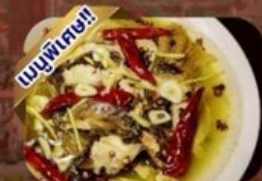
ปลาต้มพริกทอด