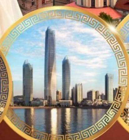
ชมวิวดาคารไฮตัน เซ็นเตอร์