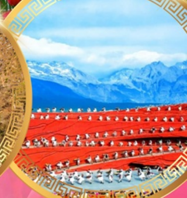
ความประทับใจแห่งลี่เจียง