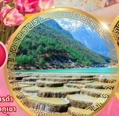
ทะเลสาบไป๋ส่วยเหอ

วัดชงจ้านหลิน ช่องแคบเสือกะโจน สระมังกรดำ เมืองโบราณลี่เจียง ภูเขาหิมะมังกรหยก ชมวิวภูเขา หิมะที่ร้าน Yun di ta ชมดอกไม้ที่สวนอุทยานชุ่ม น้ำโกวหนาน ชมดอกซากุระสวนหยวนทง